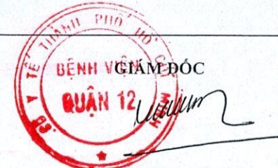
BS CKII. Nhan Tô Tài